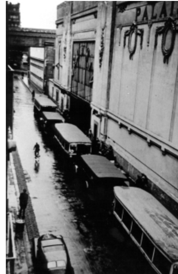
16 juillet 1942 : les autobus devant le Vel' d'Hiv'.

« Mon Dieu ! Mais c'est de la literie juive », allais-je m'exclamer. De loin, j'avais reconnu les couettes et les édredons ouatés et repiqués, dont on