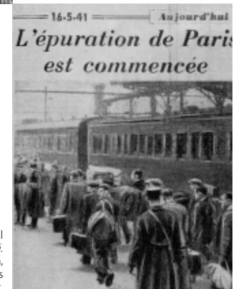
La Une du journal parisien Aujourd'hui . L'épuration, c'est le départ vers les camps du Loiret.