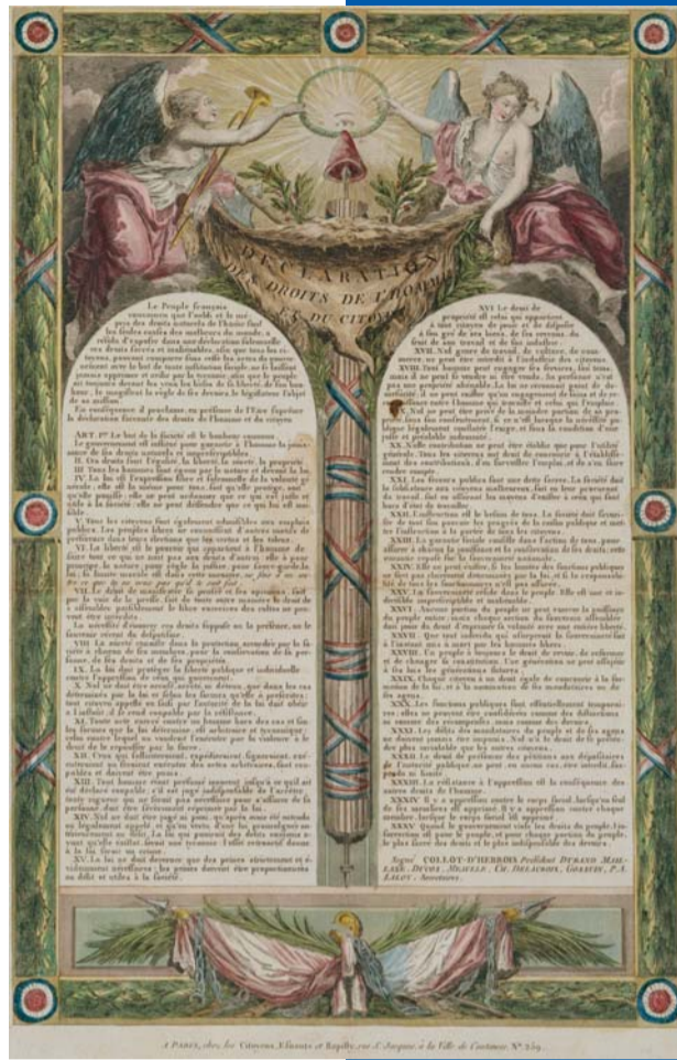
Déclaration des Droits de l'Homme et du Citoyen 10 août 1793 (impression d'époque) Paris, Centre historique des Archives nationales

L e clergé perd ses privilèges et n'est plus le premier ordre du royaume. La liberté d'opinion religieuse est reconnue le 26 août 1789 : l'Assemblée constituante adopte la Déclaration des droits de l'homme et du citoyen placée sous les auspices de l'Être suprême, dont l'article X prévoit que «nul ne doit être inquiété pour ses opinions même religieuses, pourvu que leur manifestation ne trouble pas l'ordre public établi par la loi». Dans les deux années qui suivent, le statut de citoyen est accordé aux protestants puis aux juifs.