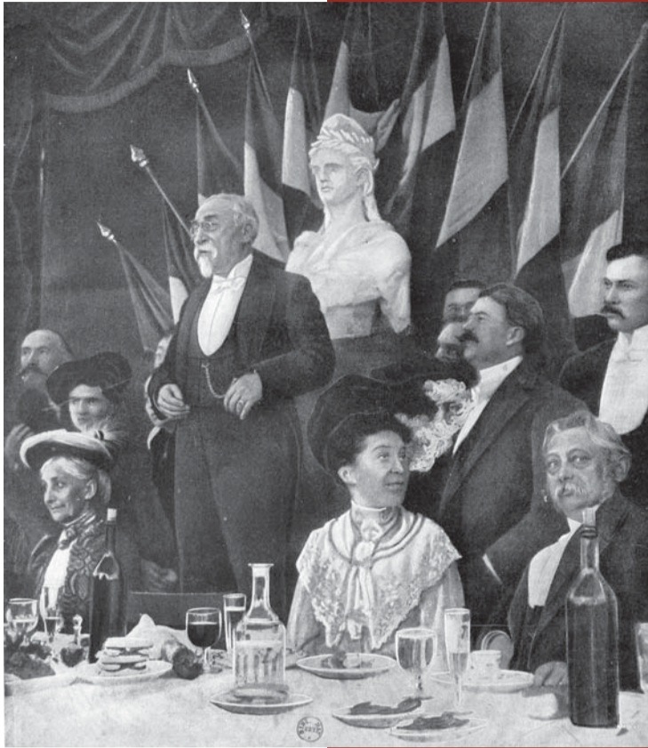
Emile Combes au banquet d'inauguration du monument dédié à Renan, à Tréguier en septembre 1903.