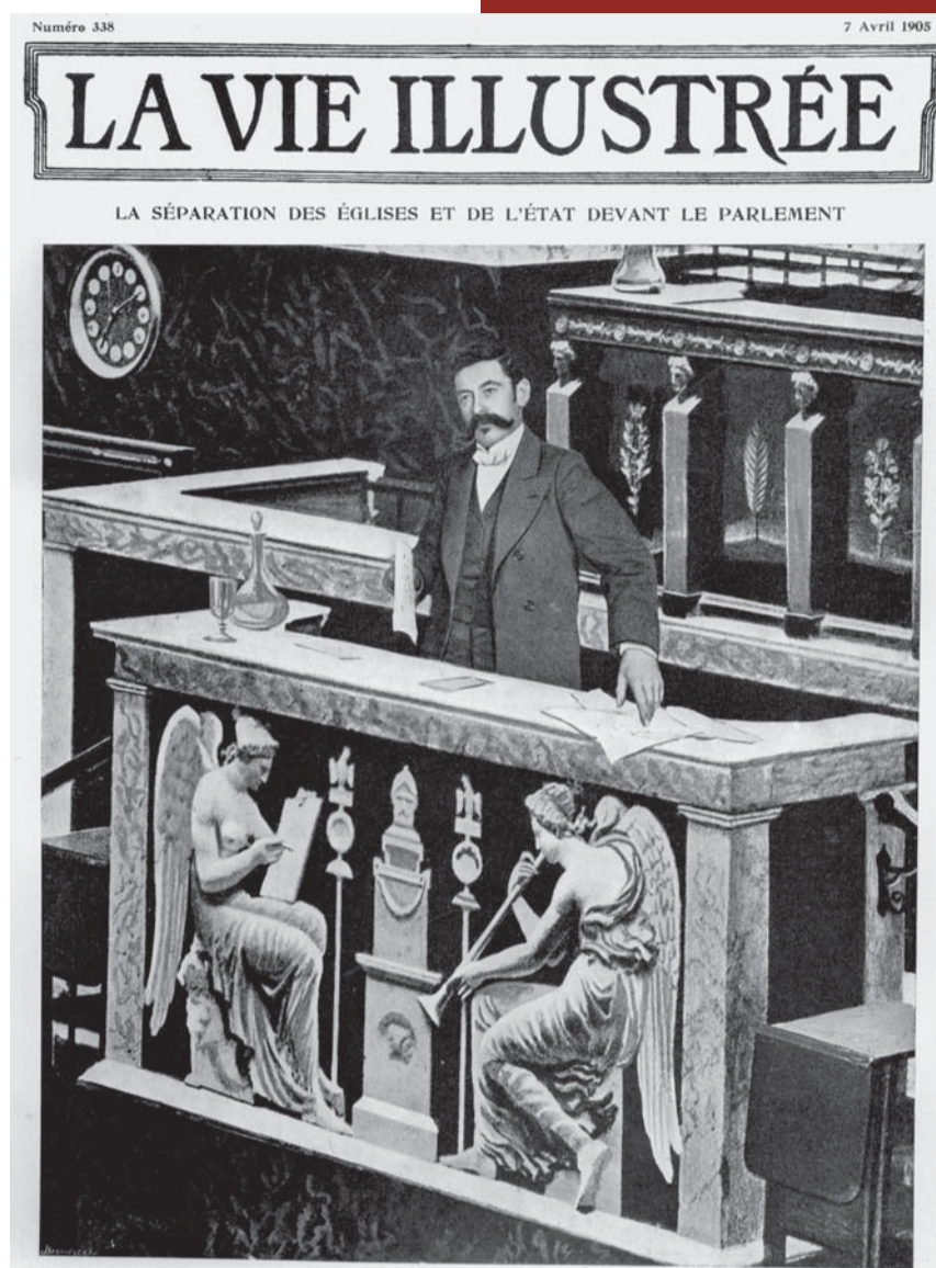
Aristide Briand à la tribune de la Chambre. Paris, avril 1905.