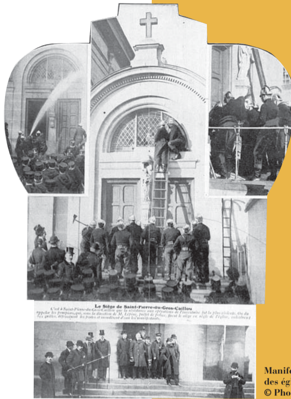
Manifestations diverses contre les inventaires des églises de Paris 1905-1906.