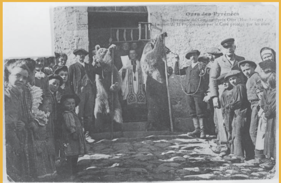
Défense de l'église de Cominac (Haute-Ariège) par des ours lors de l'opération d'inventaire, carte postale, 1906. Foix, Archives départementales de l'Ariège © AD de l'Ariège - Service photographique